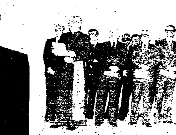
اعضاء السلك الديبلوماسي يتقدمون بوانتي يلقى كلمته باسمهم

اكبر رئيس الجمهورية السيد اليماني الهراوي ان عرفته سماعي الوحدة والوفاق من خلال الثرة الفرائز والعصيات الطائفة انت بطريفة مياشيرة وغير مياشيرة. ان تطوب صراعات جانبية في مناطق مختلفة ولا سيما الجنوب. وشهدا على انني وشعبي لن نستسلم للواقع المفروض. وقل ان استعادة جميع القوي الشرعية اللبنانية المسلحة دورها الطبيعي. وسحب الاسلحة غير الشرعية المتواجدة على ارض لبنان هي سبيل الدولة القادرة على تثبيت الامن الشرعي والزام المواقف الدولية وتحسين الجنوب اللبناني من الاحتلال وترسي افضل العلاقات مع الشقيقة سوريا على اسس الاحترام المتبادل.